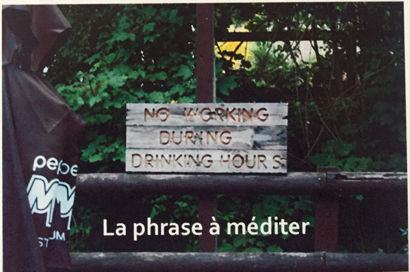
La phrase à méditer