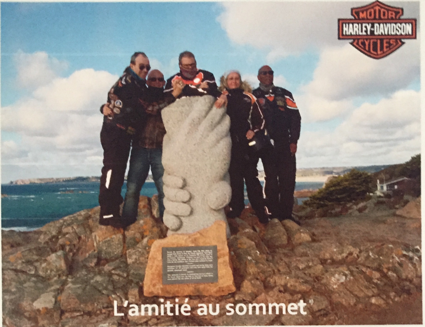
L'amitié au sommet