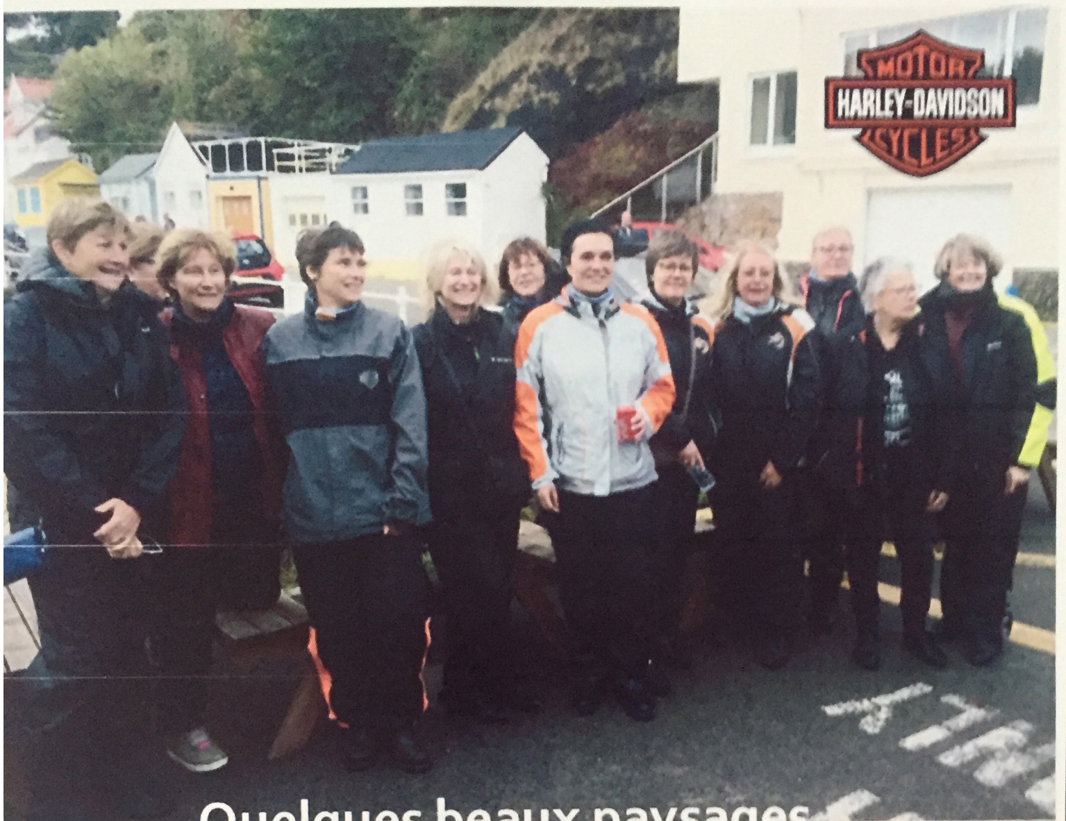
Quelques beaux paysages